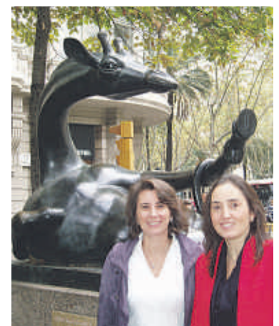
Escultura “La jirafa coqueta”, obra de Josep Granyer

Lo consiguen desde la confianza que aporta el hecho de ser, no sólo abogadas, sino conocedoras del mundo del Arte, de los artistas, de cómo funciona el sector y de su motivación por seguir aprendiendo y estar al día. También gracias a un gran trabajo de campo con el que han conseguido aglutinar conocimientos sobre una normativa muy diseminada, y con la ventaja que se deriva de toda especialización, es decir, la interrelación entre problemáticas ya trabajadas, lo que permite a Nial Advocats solucionar problemas en materia del Derecho del Arte de una manera más ágil, y acertada. Y eso sin perder la perspectiva generalista que –según consideran– todo abogado debe mantener en todos sus casos.